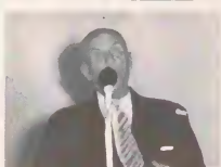
Defunto Henny Eman na palabra durante un reunion publico.